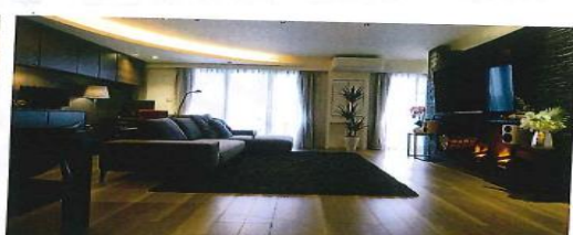
LDKを最大限に広くとり、ホテルのような居心地と日常生活の利便性を叶えた空間に。