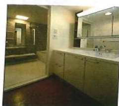
コルクタイル床の洗面室は、裸足でも安全・快適です。

マンションには上下階に住戸がある場合も多いので、近隣とのトラブル防止ためにも生活音を階下に響かせないよう、遮音性が大切。リフォームの際のフローリング素材選びには注意が必要。遮音性能の高いフローリング材を使用したり、音が伝わりにくいコルクタイルにするなどの配慮をする。